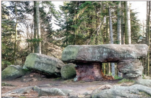
Table des Géants.

La légende rapporte que les femmes en mal d'enfants venaient le chevaucher en s'asseyant sur son sommet en forme de selle. Il sert de borne frontière depuis des siècles. Il porte encore les armoiries de l'abbaye de Marmoutier, le «M» avec la crosse de l'abbé, et celle des sires de Linange, les trois alérions (aigles).