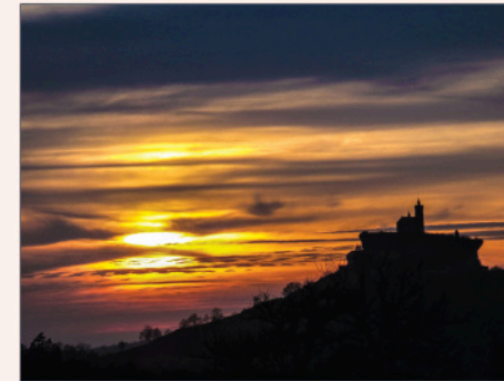
Rocher du Geissfels (rocher de la chèvre).

Il rappelle la légende de la chèvre Heidrun qui fournissait le lait de l'immortalité aux valeureux guerriers du Walhalla , le paradis de la mythologie nordique.