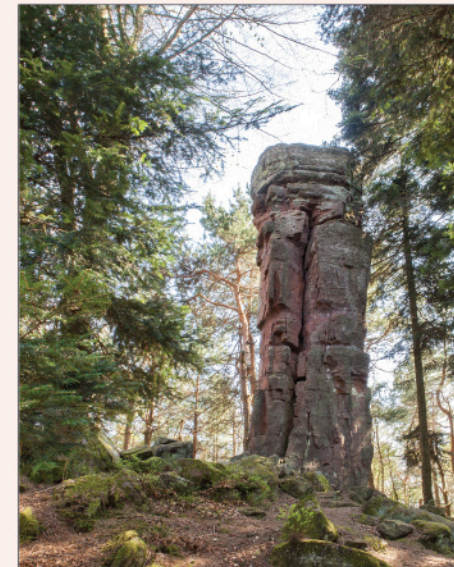
Rocher de la Spill (rocher du fuseau).

La légende rapporte que la Spill serait la pointe du fuseau du rouet de Berchta , la fileuse du temps et la compagne de Freya , l'épouse de Wotan (Odin), le dieu principal dans la mythologie nordique.