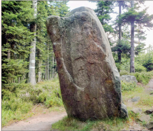
Sattelfels (Rocher de la selle).

Le Sattelfels est une pierre dressée (menhir). C'est un lieu mythique qui, selon certains, concentre et irradie l'énergie tellurique.